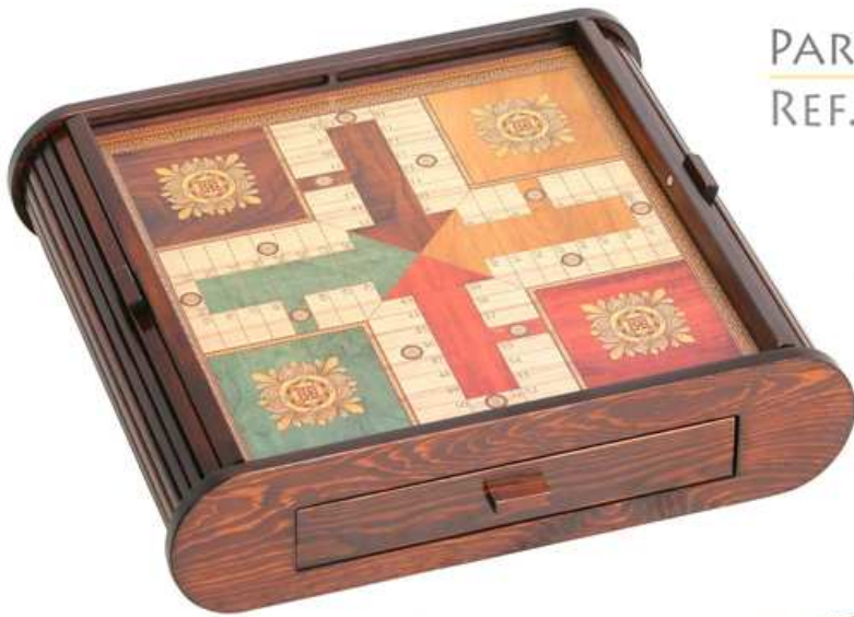
PARCHÍS PERSIANA REF. 872