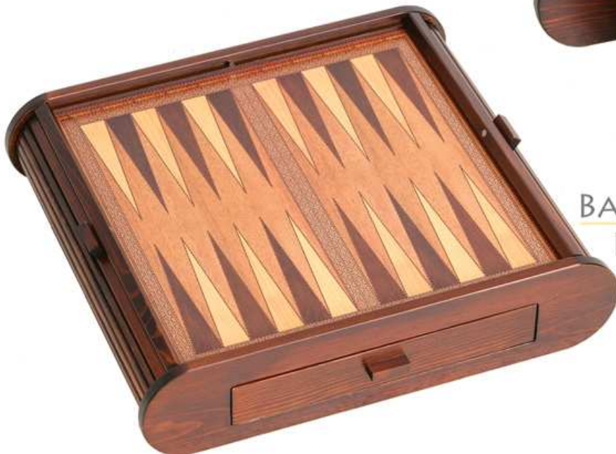
BACKGAMMON PERSIANA REF. 876